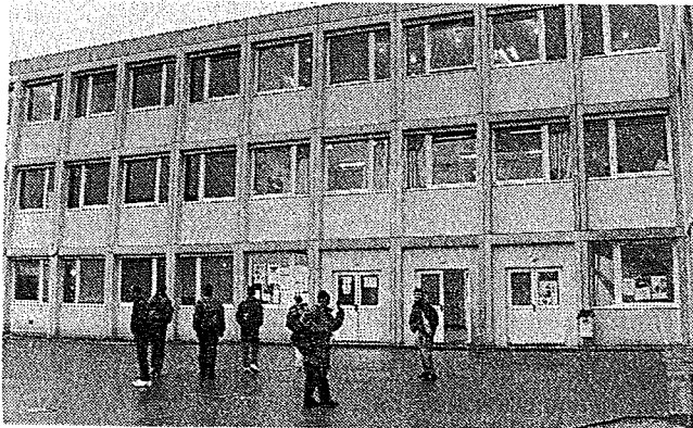
Le collège de Magny, "Claude Monet", a une capacité d'accueil théorique de 816 élèves, mais en reçoit vraiment 908.

SCOLARITÉ. Les 2 "CES" actuels sont en sureffectif global d'environ deux cents élèves et dès la prochaine rentrée plusieurs dizaines de nouveaux collégiens arriveront. Quelques élus locaux réclament un nouvel établissement, pour éviter un transport vers Menucourt.